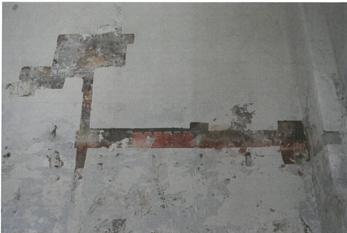
Fot 5. Główna sala modlitewna Synagogi w Bobowej, ściana zachodnia. Fragmenty polichromii widoczne w odkrywce od strony północnej.