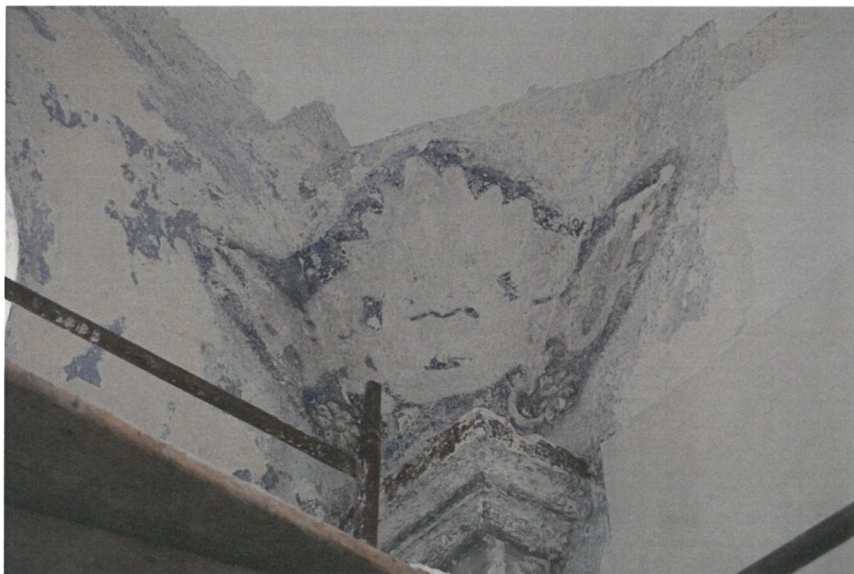
Fot 4. Główna sala modlitewna Synagogi w Bobowej, ściana wschodnia. Narożnik południowo wschodni – ślad po dekoracji sztukatorskiej, lub jej iluzjonistycznym odpowiedniku.