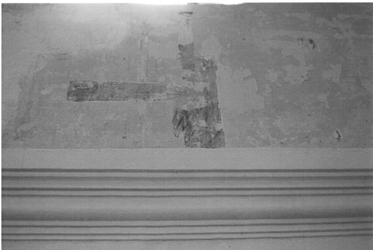
Fot 8. Główna sala modlitewna Synagogi w Bobowej, ściana południowa. Fragmenty polichromii widoczne w odkrywce.