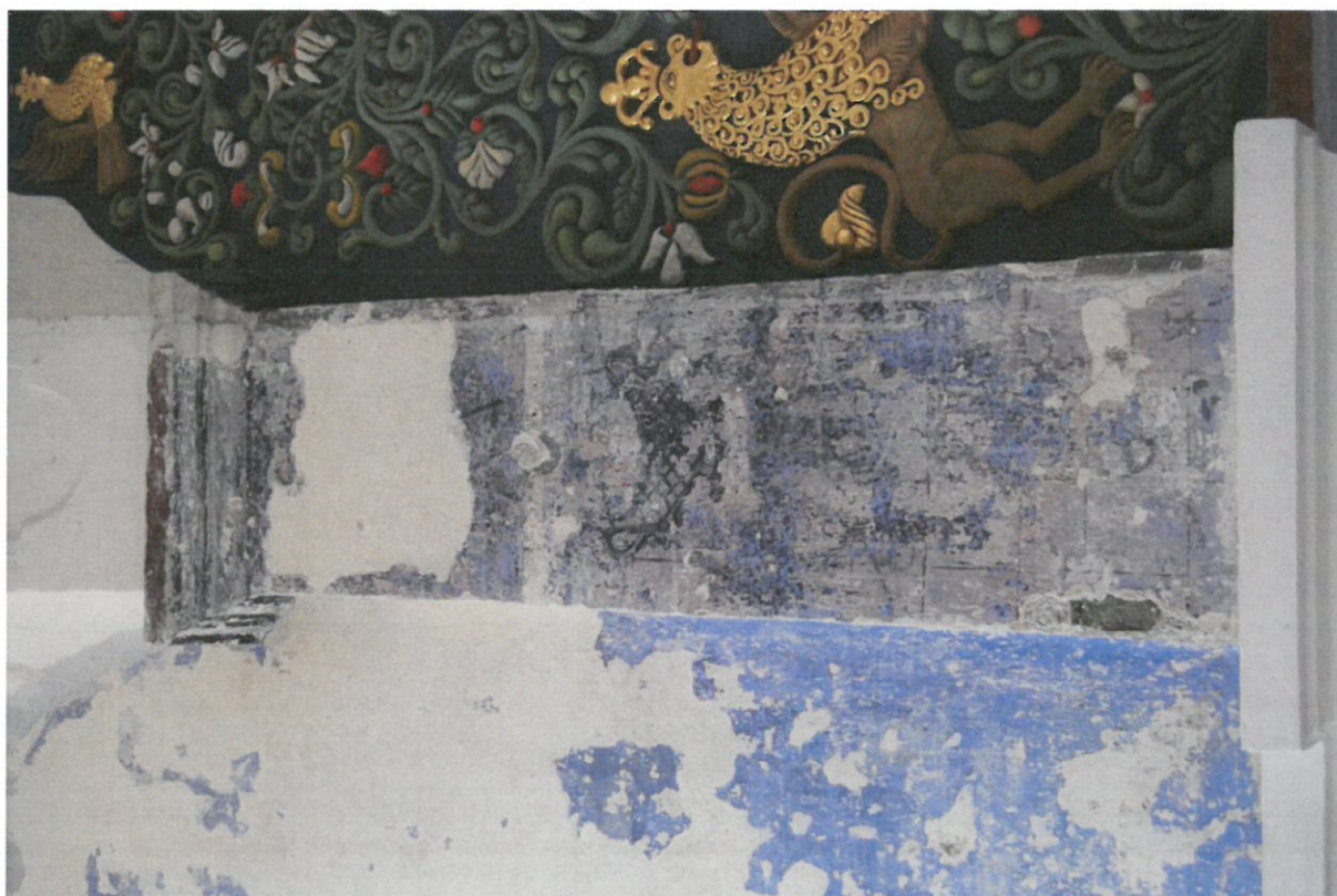
Fot 2. Główna sala modlitewna Synagogi w Bobowej, ściana wschodnia. Fragment środkowy – po zabezpieczeniu powierzchni.