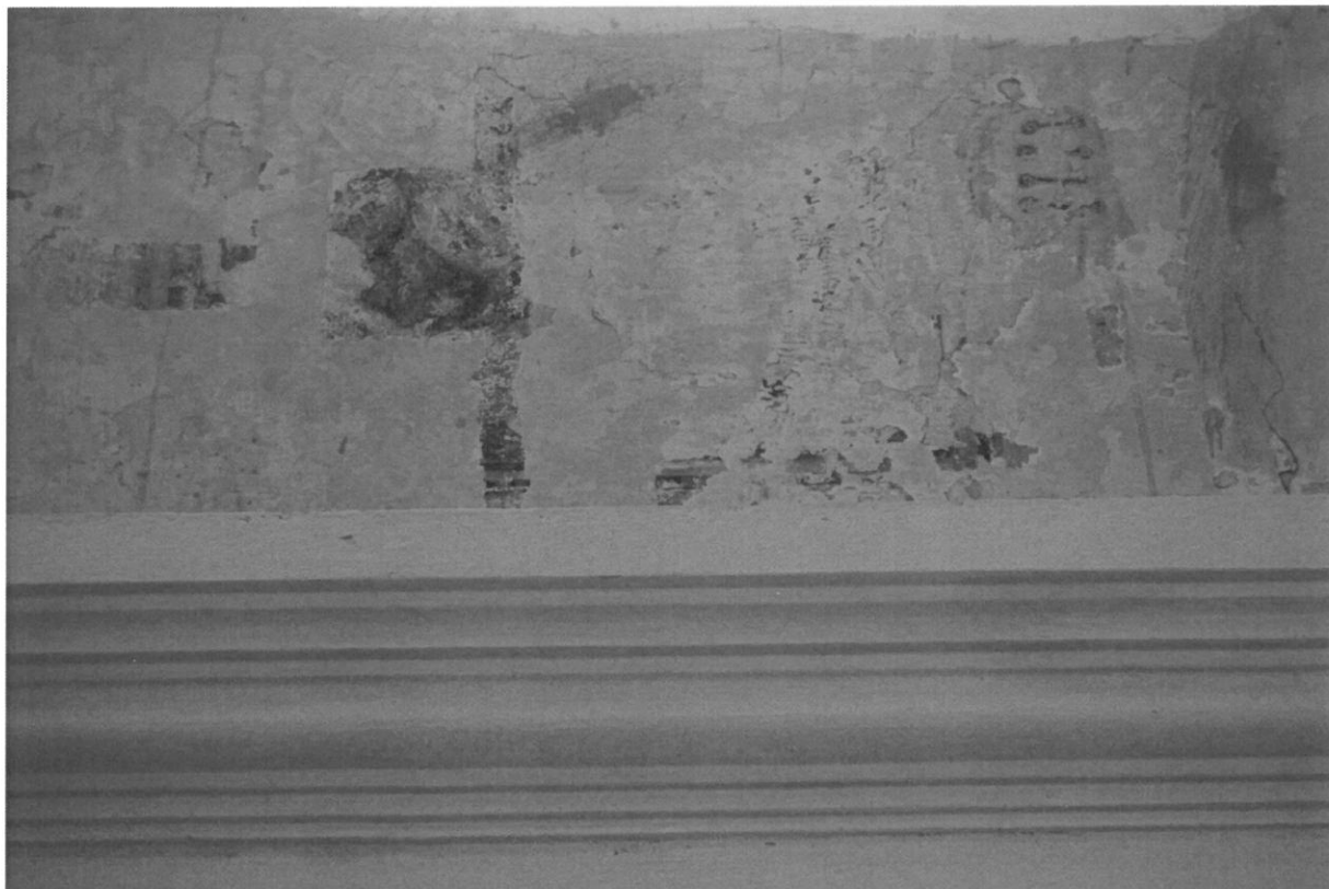
Fot 7. Główna sala modlitewna Synagogi w Bobowej, ściana południowa. Fragmenty polichromii widoczne w odkrywce.