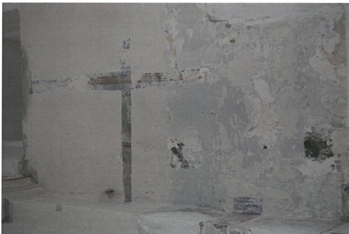
Fot 6. Główna sala modlitewna Synagogi w Bobowej, ściana zachodnia. Fragmenty polichromii widoczne w odkrywce od strony południowej.