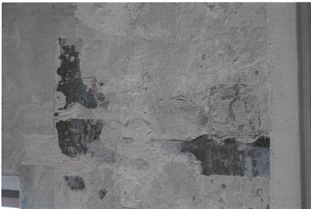
Fot 12. Główna sala modlitewna Synagogi w Bobowej, ściana północna. Fragmenty polichromii widoczne w odkrywcę.