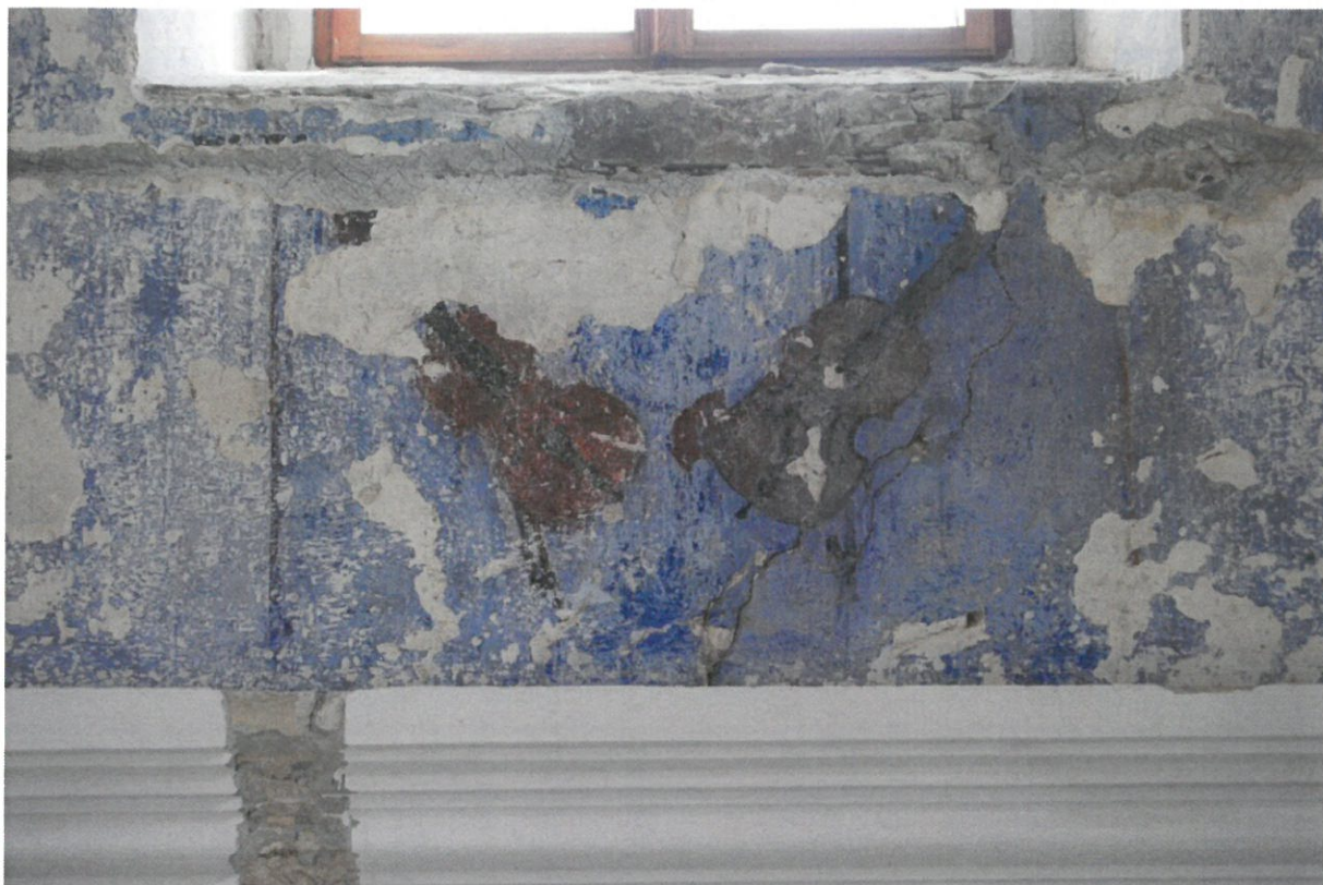
Fot 3. Główna sala modlitewna Synagogi w Bobowej, ściana wschodnia. Fragment od strony południowej – po zabezpieczeniu powierzchni.