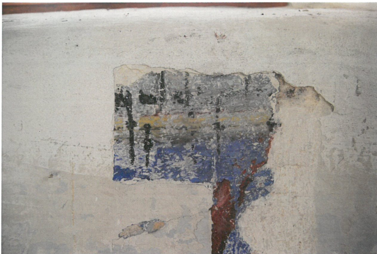
Fot 11. Główna sala modlitewna Synagogi w Bobowej, ściana północna. Powiększenie z fot nr 10 – widoczne ślady napisu.