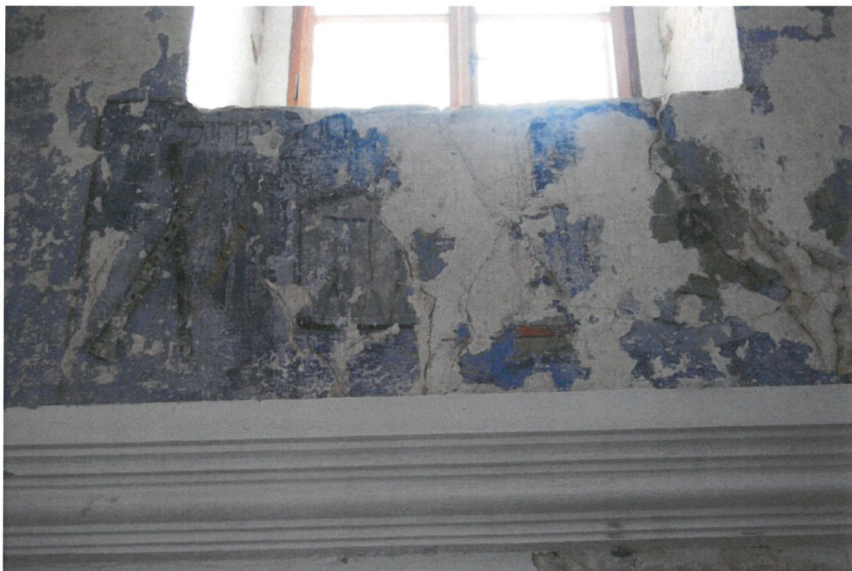
Fot 1. Główna sala modlitewna Synagogi w Bobowej, ściana wschodnia. Fragment od strony północnej – po zabezpieczeniu powierzchni.