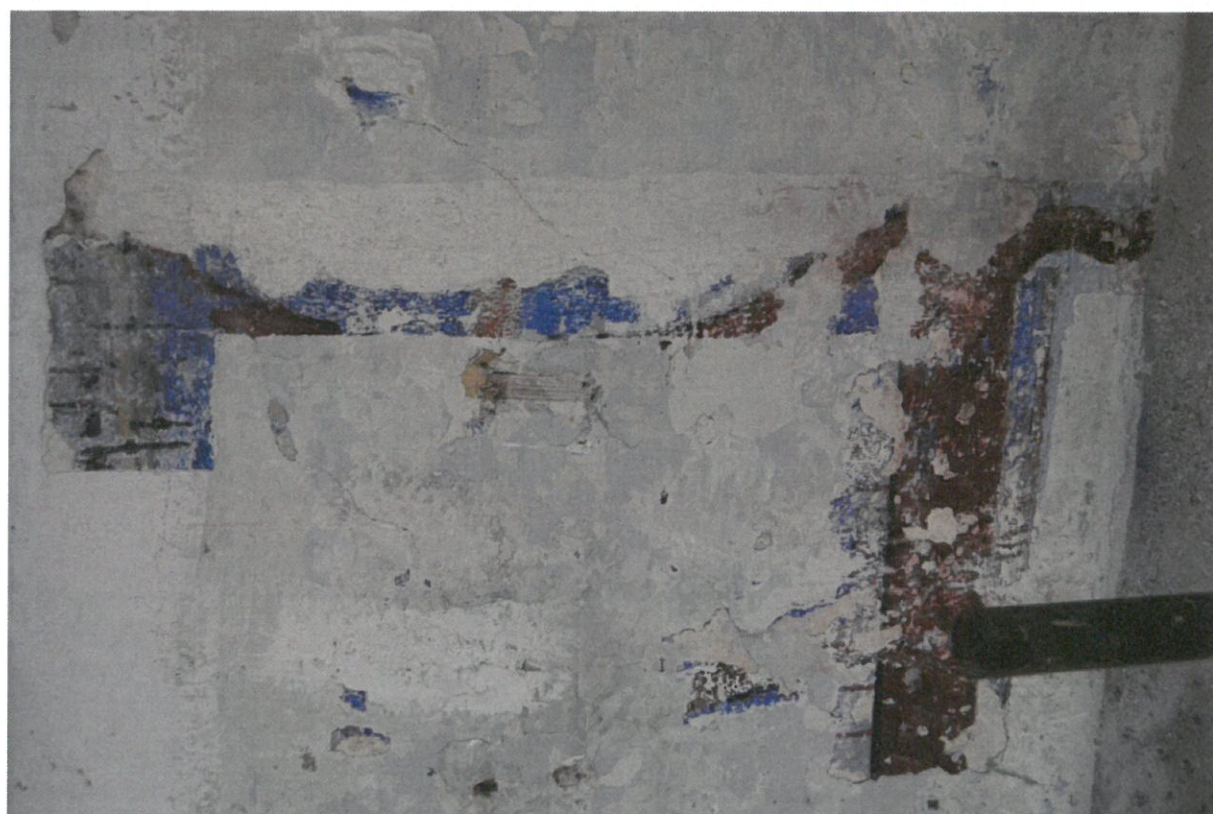
Fot 10. Główna sala modlitewna Synagogi w Bobowej, ściana północna. Fragmenty polichromii widoczne w odkrywcze.