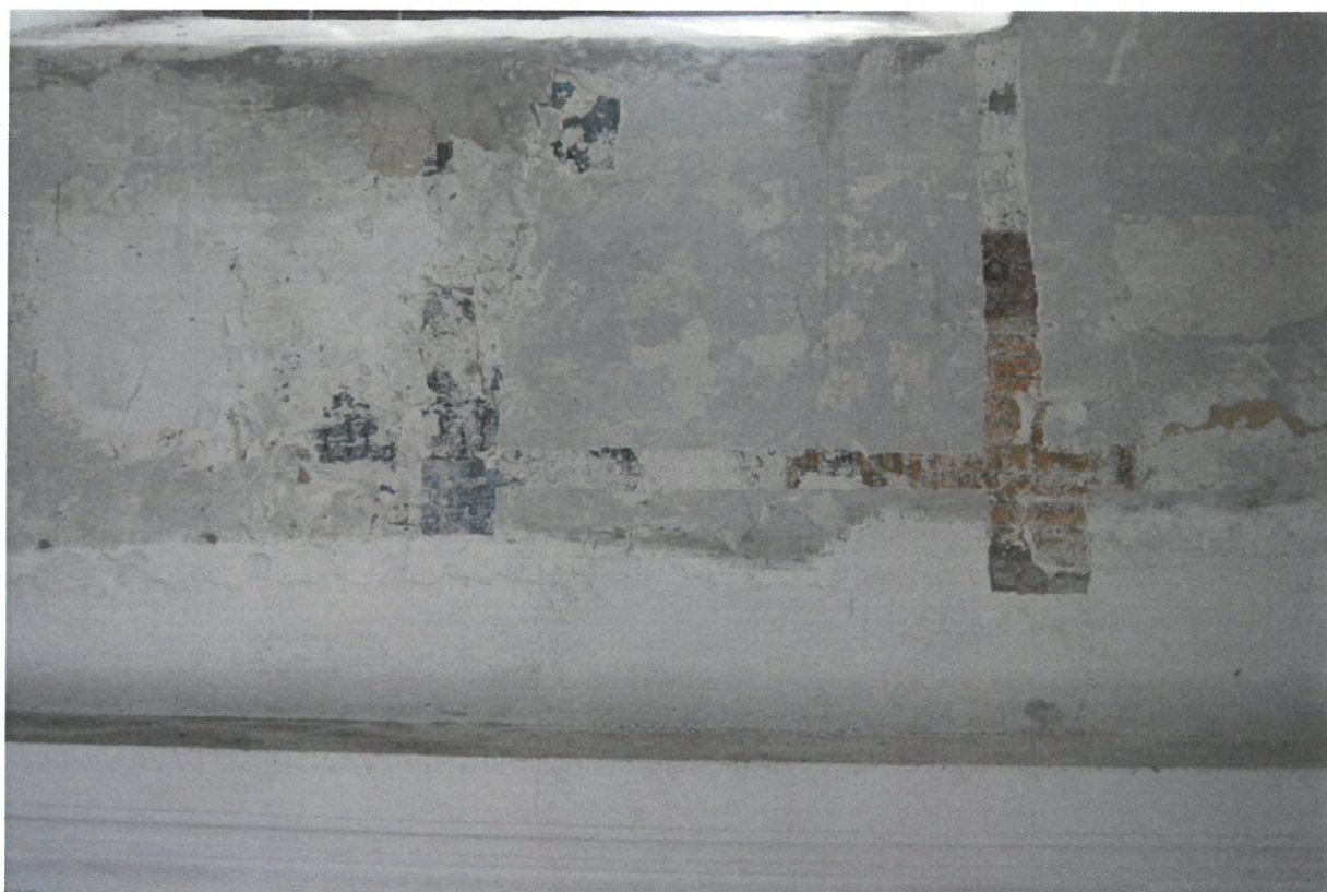
Fot 9. Główna sala modlitewna Synagogi w Bobowej, ściana północna. Fragment polichromii widoczny w odkrywcze.